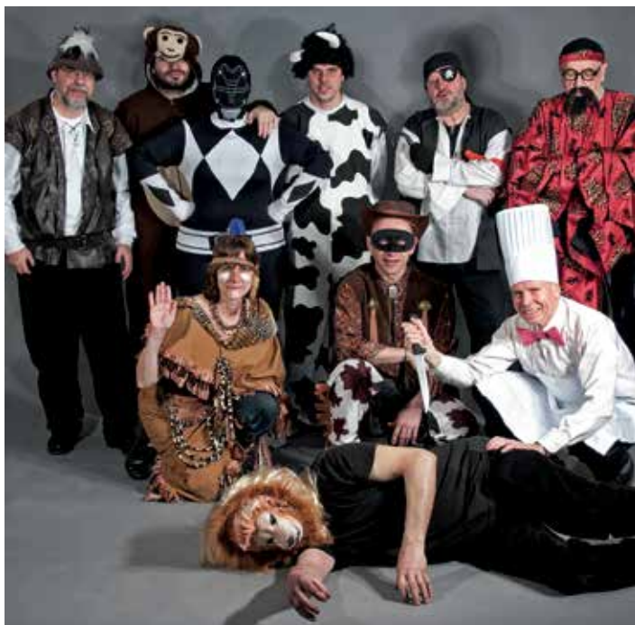
Plató: Carnaval que es celebrà el dia 19 de febrer