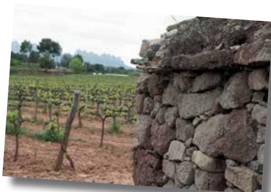
Lidia de la Cruz