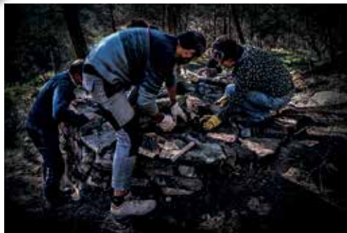
Joan Ant. Closes