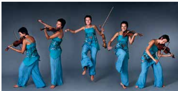
Pura Travé 3r Premi