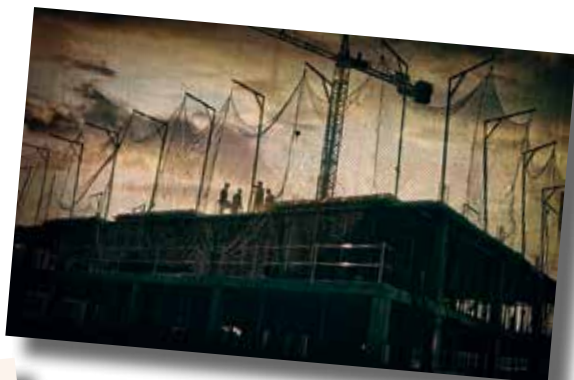
Carlos Pulido 4t Lliurament 20 punts