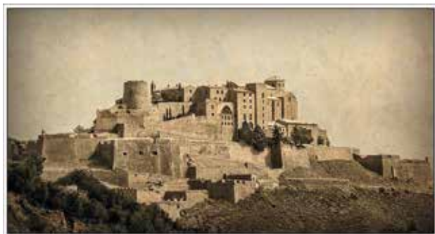
Santi Bajona 6è Lliurament 20 punts