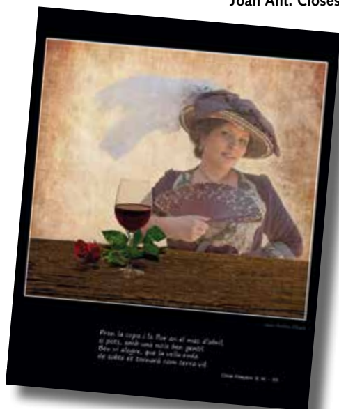
Joan Ant. Closes