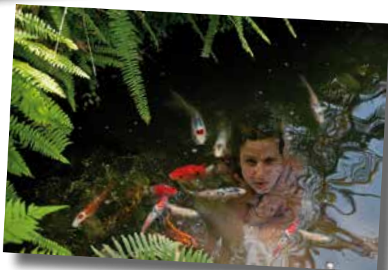
3r Premi Fotomuntatges Pura Travé