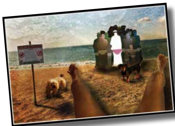
2n Premi Fotomuntatges Gabril Montes