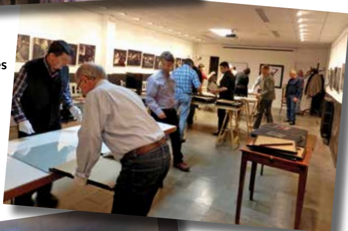
Taller de neteja de vidres