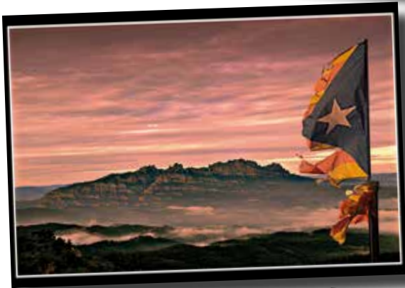
Joan Ant Closes