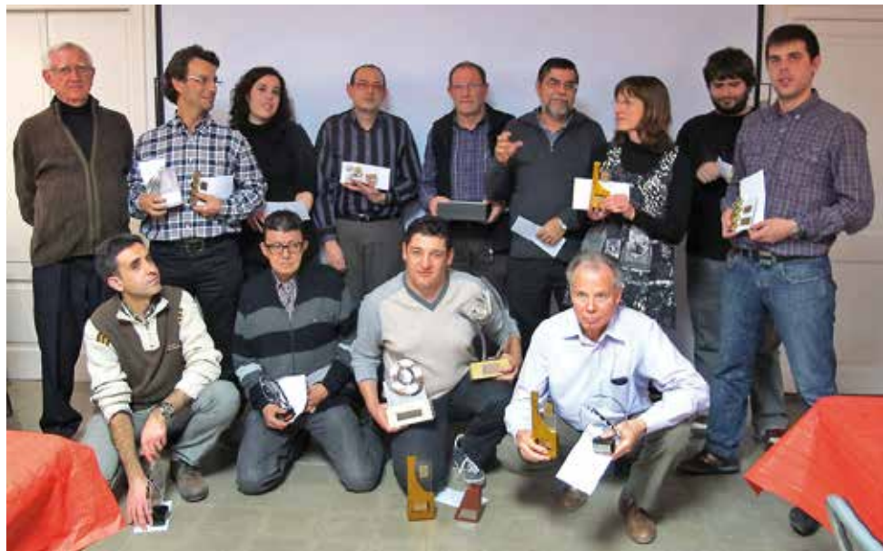
Premiats en les diferents categories Socials

El dia 20 de desembre es va celebrar el ja tradicional sopar de Nadal amb una assistència molt nombrosa; al final del sopar es va fer el lliurament dels premis dels concursos socials de l'entitat.