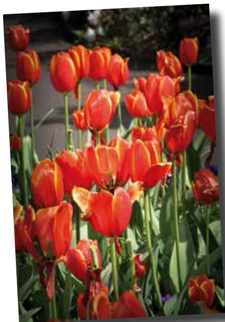
Lidia de la Cruz