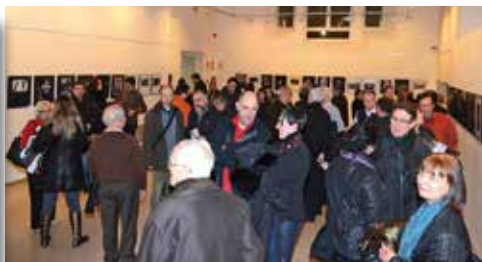
Moment de l'inauguració