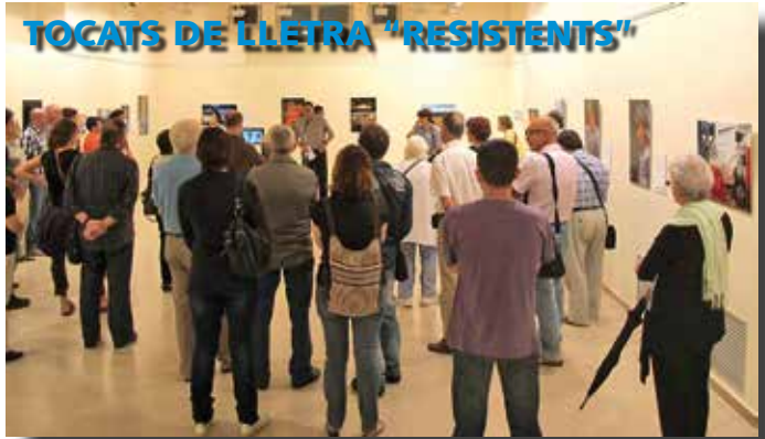
Moments de l'Inauguració de l'exposició